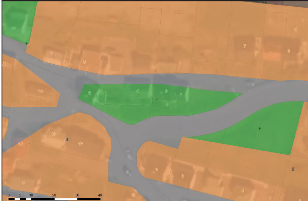
nærmynd av ætlaðu broytingini